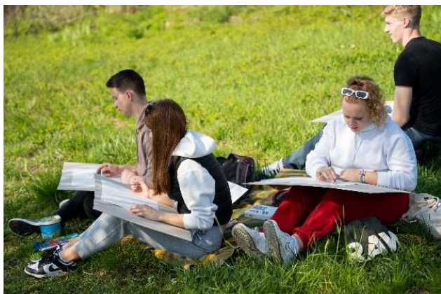
Dijaki v elementu