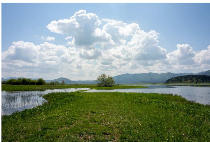
Cerknško jezero v vsej svoji naravni lepoti