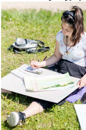
Slikanje je zelo sproščujoče

Risanje z akvareli na prvi pogled izgleda zelo preprosto, vendar je to dokaj zahtevna tehnika. Slika se lahko tako na suho kot mokro podlago, mora pa biti podlaga kakovostna. Barve se redči z vodo in s kvalitetnimi čopiči nanaša v prosojnih nanosih od najsvetlejšega do najtemnejšega tona. Slikanje v tej tehniki zahteva izkušnje, hitrost in natančnost, saj se barve hitro sušijo, napak pa se ne da več popravljati oz. prekriti. So pa slike v tej tehniki značilno živih barv. Dijaki, v resnici so prevladovala dijakinje, so izbrali čudovite pejsaže Cerknškega jezera z okolico. Na vprašanje, kako jim je všeč omenjena delavnica, so dijakinje vse po vrsti odgovarjale, da jim je tu zelo všeč, da je pokrajina na tako lep dan še veliko lepša kot sicer, da jim je všeč tako preživeti dan v naravi ob kulisi neumornega regljanja žab in petja ptic ter da bi se takšnih delavnic z veseljem še udeležile.