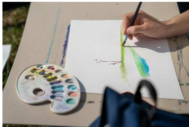
Slika v nastajanju

Risanje z akvareli na prvi pogled izgleda zelo preprosto, vendar je to dokaj zahtevna tehnika. Slika se lahko tako na suho kot mokro podlago, mora pa biti podlaga kakovostna. Barve se redči z vodo in s kvalitetnimi čopiči nanaša v prosojnih nanosih od najsvetlejšega do najtemnejšega tona. Slikanje v tej tehniki zahteva izkušnje, hitrost in natančnost, saj se barve hitro sušijo, napak pa se ne da več popravljati oz. prekriti. So pa slike v tej tehniki značilno živih barv. Dijaki, v resnici so prevladovala dijakinje, so izbrali čudovite pejsaže Cerknškega jezera z okolico. Na vprašanje, kako jim je všeč omenjena delavnica, so dijakinje vse po vrsti odgovarjale, da jim je tu zelo všeč, da je pokrajina na tako lep dan še veliko lepša kot sicer, da jim je všeč tako preživeti dan v naravi ob kulisi neumornega regljanja žab in petja ptic ter da bi se takšnih delavnic z veseljem še udeležile.