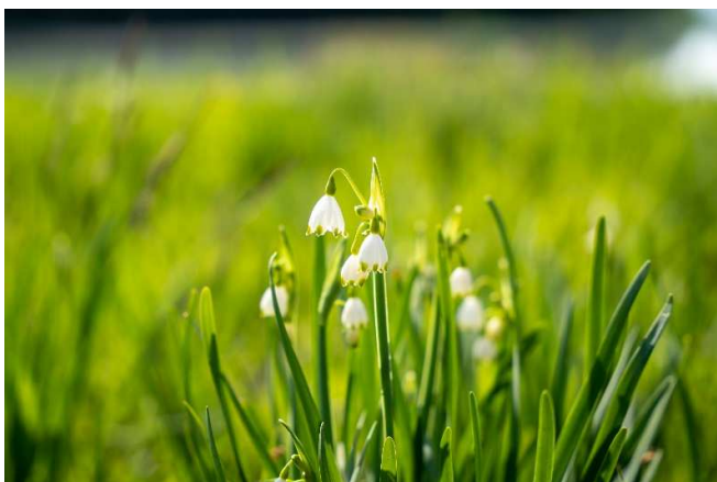
Veliki zvonček (kronica)

Dijaki na fotografski delavnici so se učili, kako nastaja foto zgodba, predvsem pa so sledili delavnicam in jih ujeli v svoj objektiv. Vse fotografije, ki so tu objavljene, so s fotografske delavnice pod mentorstvom prof. Mihe Došlerja.