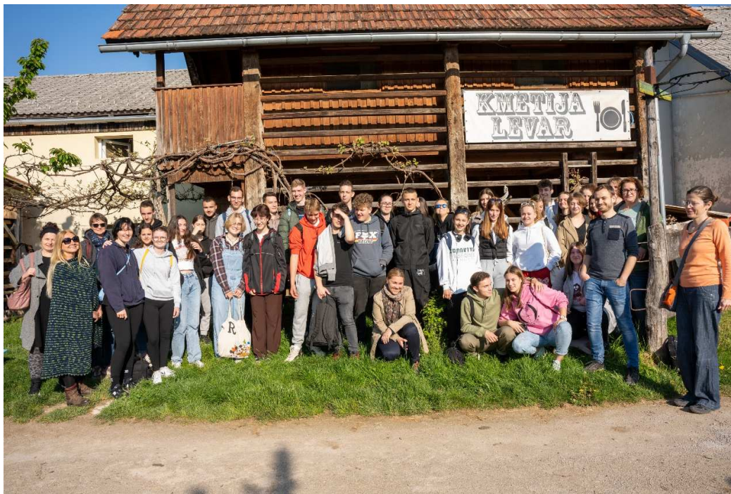
Udeleženci 19. srečanja Unescovega projekta »Jezero je, jezera ni« pred kozolcem turistične kmetije Levar, 10. 5. 2022